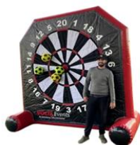
Cible Dart Foot

Montrez votre adresse au Dart Foot : ce jeu de précision combine le football et le jeu des fléchettes.